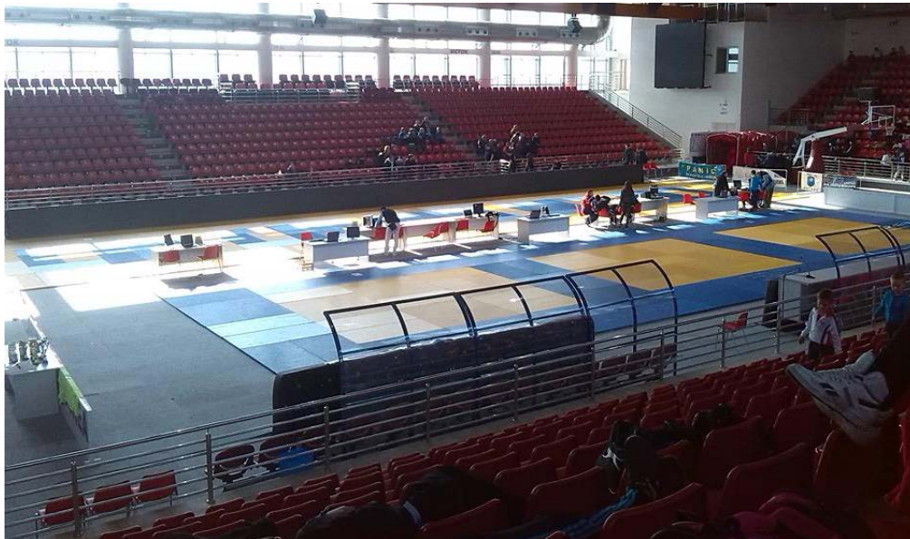
JUDO (Unutrašnji izgled dvorane) (Inner look)