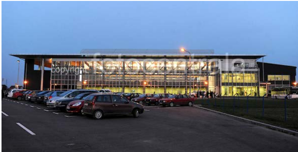
Vanjski izgled dvorane (Outer look at the Sports Hall)