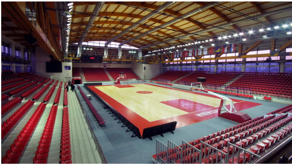
Unutrašnji izgled dvorana (Inner look)